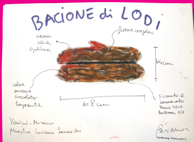
"BACIONE DI LODI" Olio su cartoncino - 24x33 cm