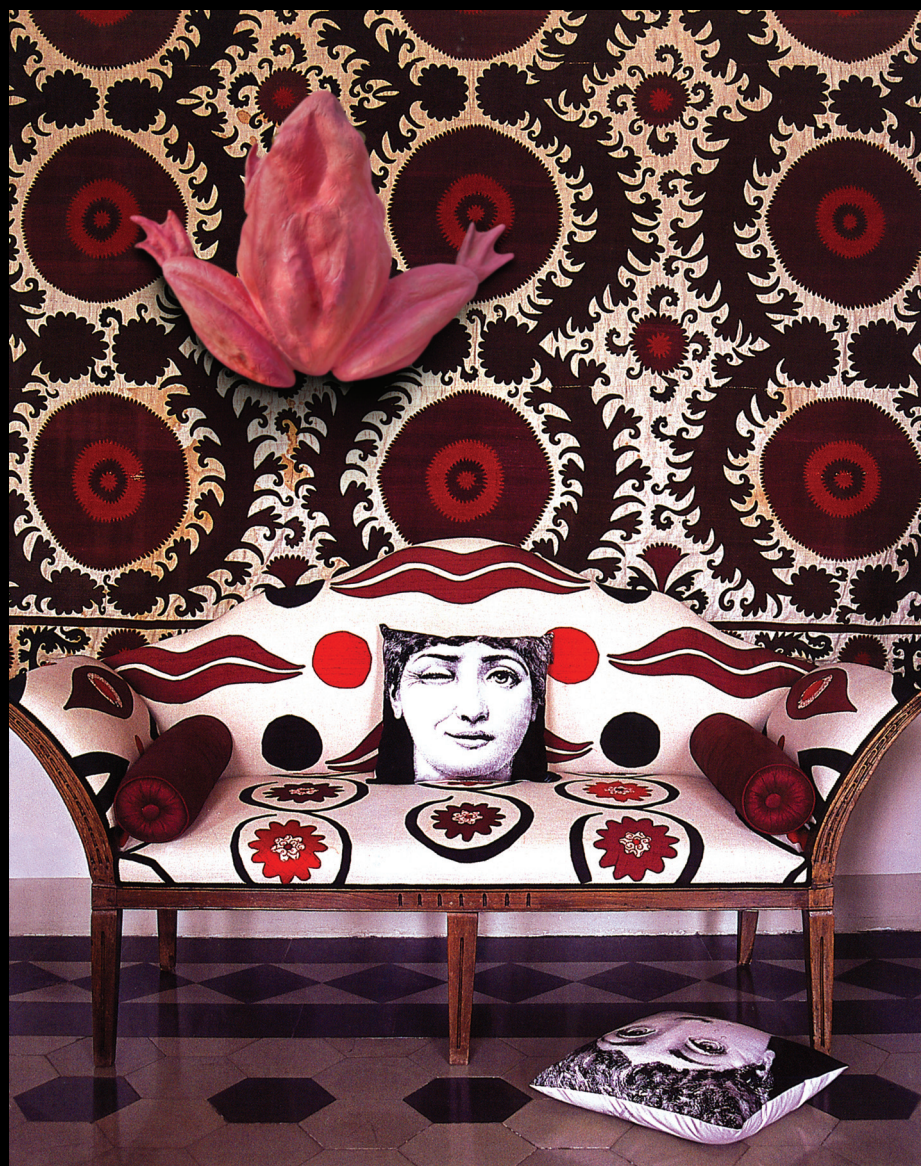
Book ONE, 2008